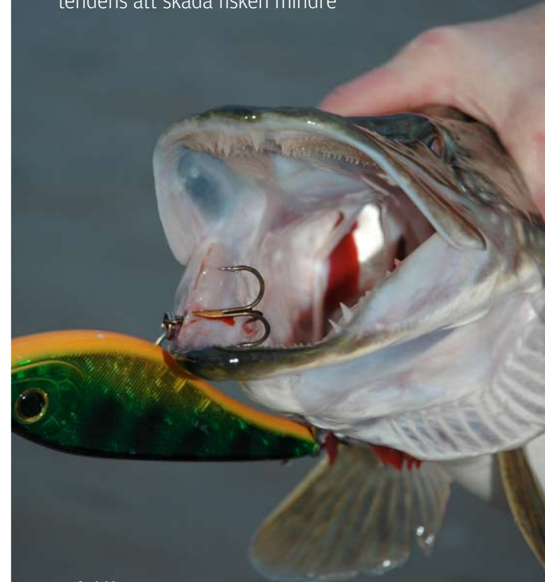
PLATS för bildtext..... 6

”Mindre krok har en viss tendens att skada fisken mindre”