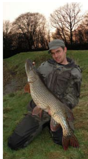
PLATS för bildtext.... 5

den kvar på plats, ibland inte. Du lär märka vilket. Enklare kan det inte bli.