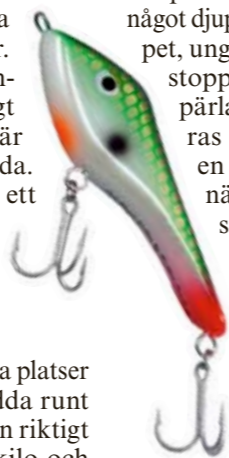
PLATS för bildtext..... 3

Ett sätt att bottenmeta fungerar på följande sätt: En bit ovanför betet/tafsen sätter du ett sänke, kul eller Catherine på ungefär 10 gram, inte mer. Lite beroende på om platsen du fiskar på är stillastående eller rinnande. Sedan fixerar du ett helt vanligt flöte lämpat för gäddmete som ställs något djupare än själva bottenjupet, ungefär 60-70 cm. Använd stoppknut ovanför en liten pärla som självfallet regleras ovan flötet. Då får du en känslig tackling först när du vevar in linan och så att säga spanner upp det hela så att flötet står lodrätt. När gäddan tar betet märker du det omgående. Antingen dyker flötet rätt ner och gäddan simmar iväg med betet i sin käft eller också lyfter det och lägger sig på ytan, vilket är det klart vanligaste nappet när gäddan har plockat upp det från botten. Ibland står