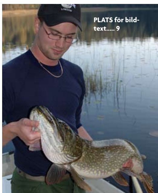
PLATS för bildtext..... 9

vattnet har en temperatur på mellan 5-12 grader på ett ungefär. Kanske som allra bäst när tempen i vattnet ligger på mellan 6-8 grader. Perioder då gäddan ofta håller sig i närheten av bottenregionen. Både kallare och varmare fungerar oftast levande bete bäst. Alltså gäddmete med dött bete fungerar bra under senhöst och vår samt vintrar när Kung Bore liksom glömt av Sverige. Något annat att tänka på är att i vissa vatten fungerar inte gäddmete med dött agn lika bra som levande, hur du än försöker.