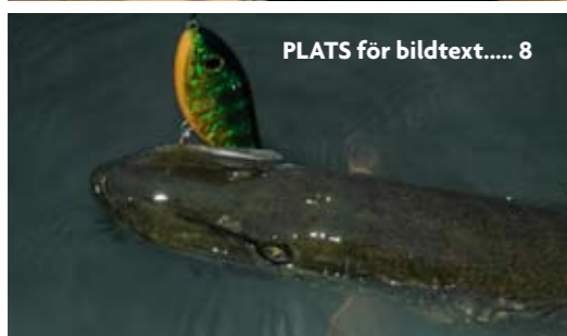
PLATS för bildtext..... 8

Fiskekort till ovan nämnda platser i Emån hittar du bland annat på Hultsfreds Turistbyrå, tel: 0495-24 05 05 eller hos Virserums Turistbyrå, tel: 0495-307 87.